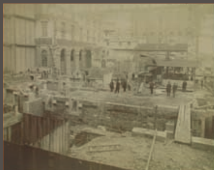
Construction du bâtiment A. Photogr., XIXe s. Construction of the building A'

Les trois sondages réalisés dans la cour du Midi, la plus au sud du site de l'Hôtel-Dieu, en ont rappelé la création tardive. Ce n'est qu'à la fin du XIXe siècle que l'architecte Paul Pascalon procède à l'agrandissement de l'hôpital qui inclut cette cour. Les constructions remplacent les dernières maisons qui occupaient depuis plusieurs siècles la rue de la Barre. Quand elles n'ont pas été détruites au XIXe siècle par les fondations de l'hôpital, puis au XXe par la pose des réseaux et les aménagements successifs, les traces de ces habitations ressurgissent. Des murs, caves et puits en pierres dorées redessinent ainsi le quartier du Bourg Chanin, jusqu'à coïncider parfois précisément avec des maisons identifiées sur les plans anciens (rente noble d'Ainay). Un sol en tommettes correspond à l'intérieur d'une pièce.