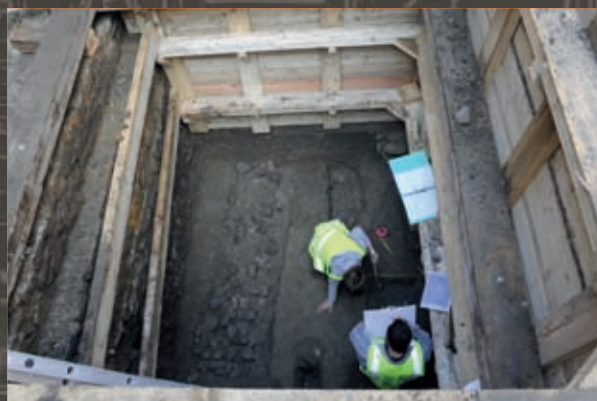
Relevé des niveaux antiques dans l'un des sondages Reading of the ancient levels in one of the excavations

Epargnés par les fondations des maisons Renaissance du Bourg Chanin puis par les agrandissements de l'hôpital, des vestiges antiques sont apparus. Des sols en béton lissé blanc (terrazzo) et en terre battue, des éléments de caniveau et le tronçon d'un égout maçonné évoquent la mise en place d'un habitat permanent à proximité du fleuve. Les dimensions des tuiles utilisées pour le caniveau sont caractéristiques du IIe siècle ap. J.-C. L'étude de la céramique démontre que le quartier semble bien urbanisé dès le milieu du Ier siècle ap. J.-C.