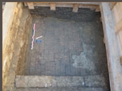
Sol moderne en tommettes de terre cuite Modern floor with terracotta tiling