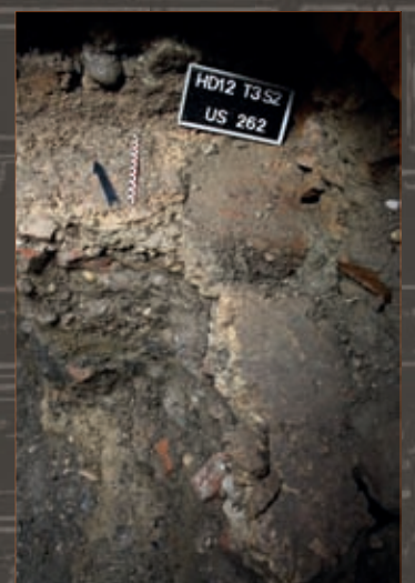
Vestiges de sol en béton antique (terrazzo) Remains of ancient concrete floor (terrazzo)