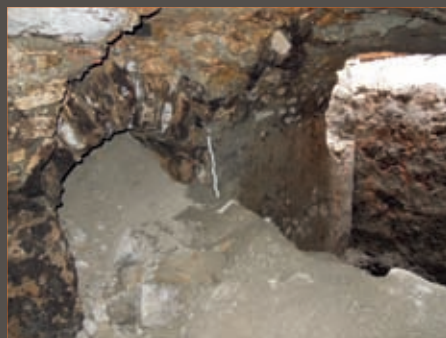
Cave moderne d'une maison du quartier du Bourg Chanin Modern cellar of a house in the Bourg Chanin district