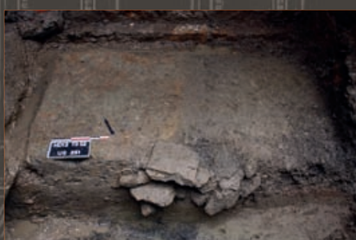
Sol antique en terre battue Ancient floor with hard-packed surface

It was because they were spared by the foundations of the Renaissance houses of the Bourg Chanin then by the hospital, that the ancient remains appeared. Floors made out of white smoothed concrete (terrazzo) and clay, parts of open sewers and the section of a brick-built sewer point to a permanent dwelling having been established close to the river. The dimensions of the tiles used for the sewer are characteristic of the 2nd century A.D. Analysis of the ceramic shows that the district seems to have been very urban from the middle of the 1st century AD.