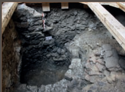
Puits moderne Modern well