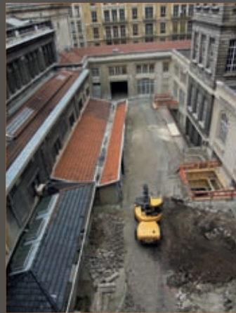
Vue générale des sondages de la cour de la Midi General view of the excavations

Les trois sondages réalisés dans la cour du Midi, la plus au sud du site de l'Hôtel-Dieu, en ont rappelé la création tardive. Ce n'est qu'à la fin du XIXe siècle que l'architecte Paul Pascalon procède à l'agrandissement de l'hôpital qui inclut cette cour. Les constructions remplacent les dernières maisons qui occupaient depuis plusieurs siècles la rue de la Barre. Quand elles n'ont pas été détruites au XIXe siècle par les fondations de l'hôpital, puis au XXe par la pose des réseaux et les aménagements successifs, les traces de ces habitations ressurgissent. Des murs, caves et puits en pierres dorées redessinent ainsi le quartier du Bourg Chanin, jusqu'à coïncider parfois précisément avec des maisons identifiées sur les plans anciens (rente noble d'Ainay). Un sol en tommettes correspond à l'intérieur d'une pièce.