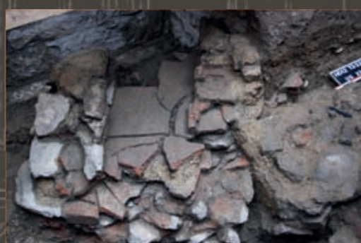
Caniveau antique constitué de tuiles en terre cuite Ancient sewer made out of terracotta tiles