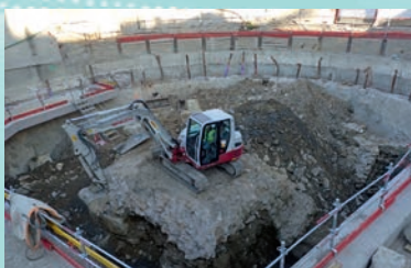
Fouille de la culée du pont du Change (mars 2019)

2019-2020 fouille des deux premiers niveaux de parking et réalisation de tranchées dans les niveaux inférieurs