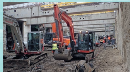
Pelles mécaniques sur le chantier du niveau -2 (avril 2019)