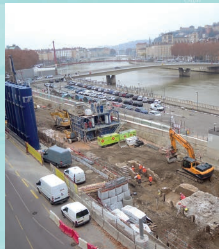
Vue générale du chantier du quai (décembre 2017)