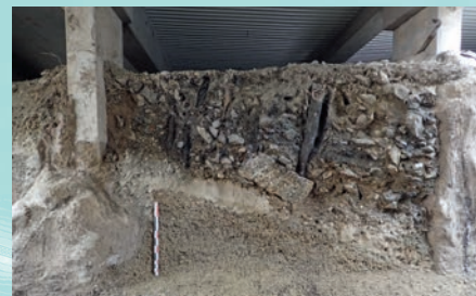
Pieux de fondation des maisons médiévales sur la rive, niveau -3 (juillet 2019)