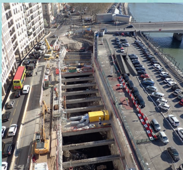
Vue aérienne du chantier depuis la grue (mars 2019)